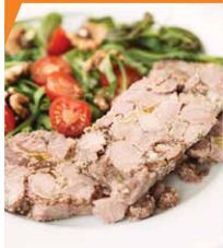
Ветчина из говядины со сливками