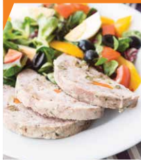
Ветчина из свинины и индейки с каперсами