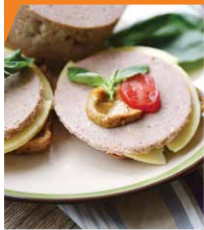
Колбаса домашняя «Докторская»