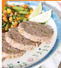
Ветчина из говядины и судака