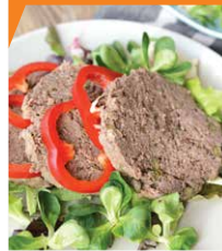
Ветчина из свиного языка с каперсами