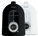
Увлажнитель воздуха RHF-3301