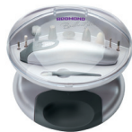
Маникюрный набор RNC-4901